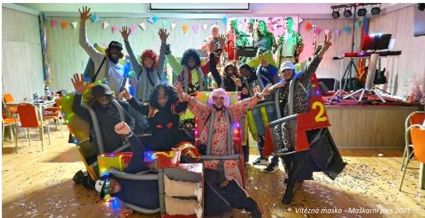
Vítězná maska - Maškarní ples 2025